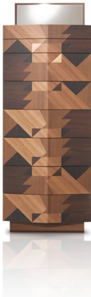
design Alessandro Mendini 2014